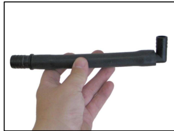
Fig. # 3