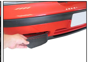
Fig. # 7