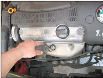
Fig. # 1

For the cleaning instructions please visit our website: www.knfilters.com/cleaning