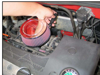
Fig. # 6