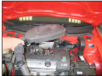
Fig. # 2