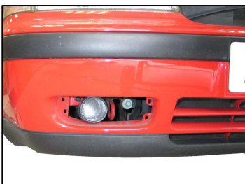
Fig. # 8