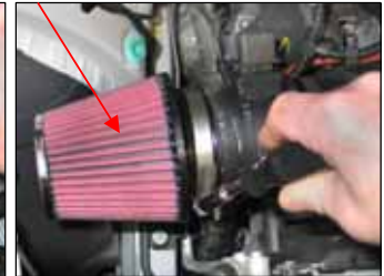
Fig. # 16