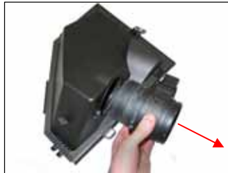
Fig. # 14