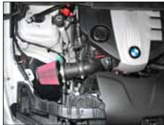
Fig. # 18