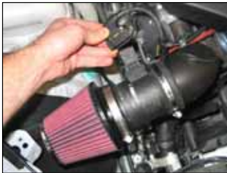
Fig. # 17