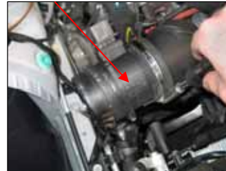
Fig. # 15